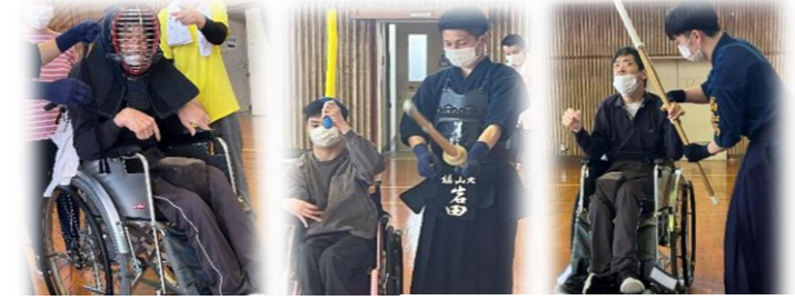
【胴着を着るって初めて♪】 【本物の竹刀を振って感激】