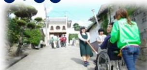
【前回の我が街知つとこ隊】

私たちの住む町で、避難を要する災害が起きたらどうしますか? 車椅子等での避難はどうすればいい…?危険箇所は? もしもの時に備えて、体験してみませんか? 参加者募集中です。皆様ふるってご参加くださいませ。